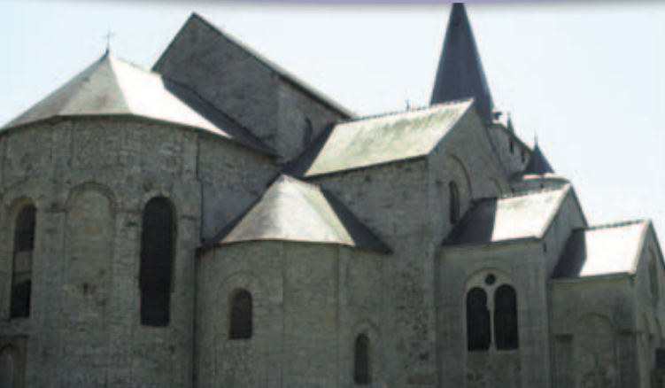
1 L'église Saint-Hadelin* De kerk van Saint-Hadelin